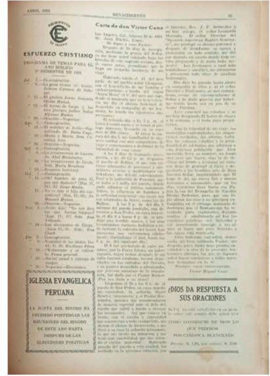
PROGRAMA PARA EL ESFUERZO CRISTIANO JULIO - DICIEMBRE 1924