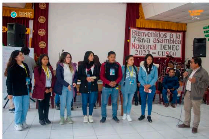
Consejo Nacional de Esfuerzos Cristianos - CONEC 2024-2025