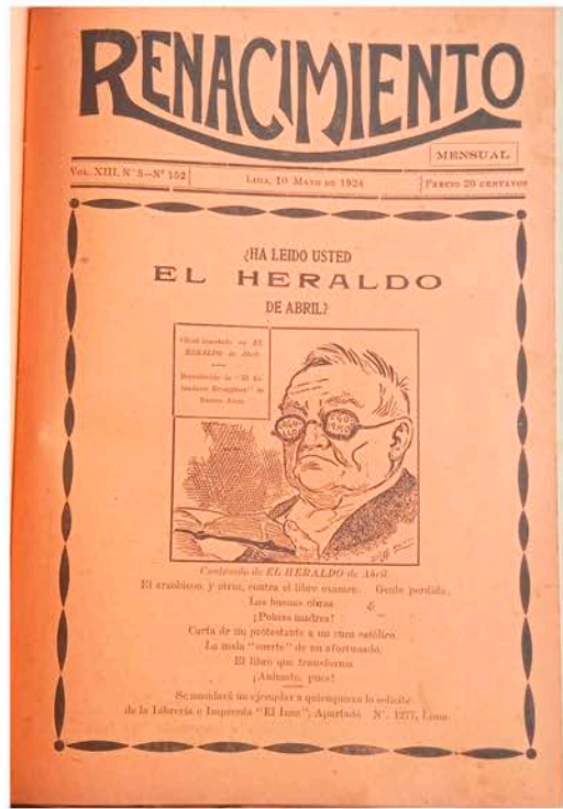
TAPA DEL 10 DE MAYO 1924