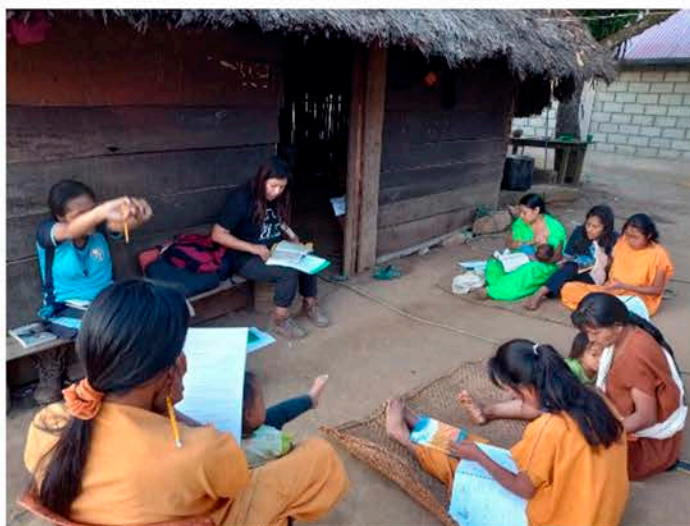
Misionera entre los Nomatsiguengas.

¿Quieres ser parte de esta misión? Comprométete como Iglesia a ayudar a los misioneros, ya sea orando, ofrendando, viajando o recibiendo. Como dice Mateo 24:14: "Y este evangelio del reino se predicará en todo el mundo como testimonio a todas las naciones, y entonces vendrá el fin".