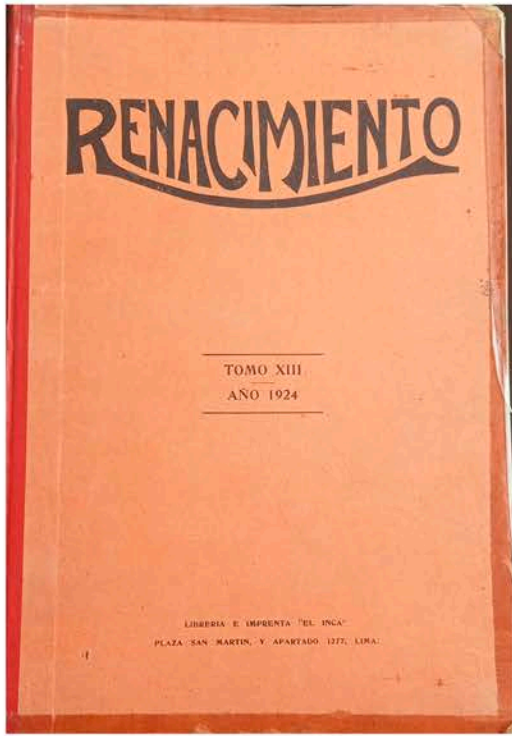
TAPA DEL TOMO XIII AÑO 1924